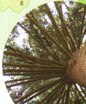
Ejemplar de Ciprés de Lawson, originario de Noroeste de América, visto desde el suelo. Este árbol tiene aproximadamente 50 años.

Ese mismo año se empezaron las labores de acondicionamiento del vivero, que produciría una media de 250.000 plantas/año; número que empieza a disminuir a partir de 1966 debido a la centralización de la producción en viveros mecanizados, para pasar en 1992, a constituir un interesante arbolito que hoy supone una grata sorpresa de conservación y diversidad.