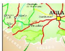
Parque Regional de la Sierra de Gredos