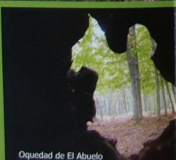
Oquedad de El Abuelo