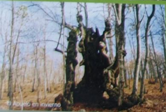
El Abuelo en invierno