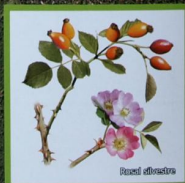
Rosa de albarizana