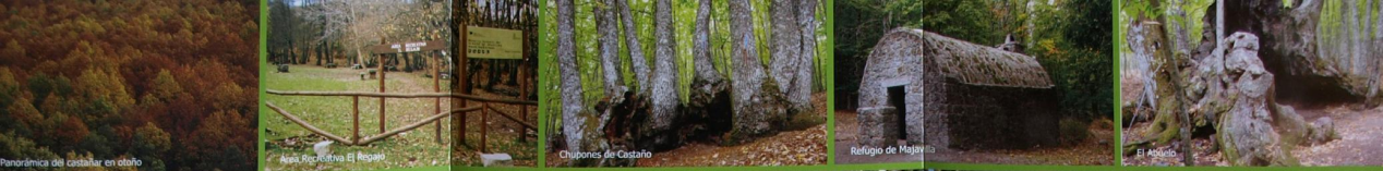
Panorámica del castañar en otoño