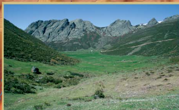
El valle del Naranco muestra una clara morfología glacial, con fondos anchos y de escaso desnivel limitados por laderas empinadas y cortados de roca desnuda.