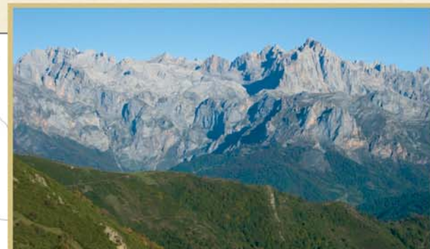
Desde el puerto de San Glorio se puede seguir un camino asfaltado que sube al collado de Llesba (2,2 km) para admirar una grandiosa panorámica de los Picos de Europa.