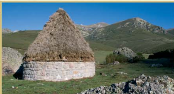
En la zona de Boca Culebrejas se ha reconstruido un chozo de horma, con base circular de piedra y techumbre vegetal de escobas, como los que solían utilizar antaño los pastores cuando pernoctaban en las majadas con sus rebaños.