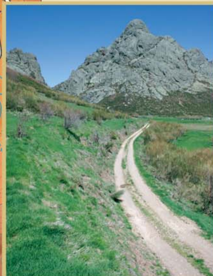
El Portillo del Boquerón comunica la Vega Tarna y el valle del Naranco por un cómodo y espectacular paso de montaña abierto a través de los conglomerados del Pico de la Devesa y la Peña la Nave.