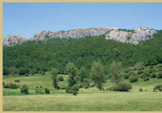
Sometido a un aprovechamiento sostenible desde antiguo, el monte La Boyería estaba reservado al pasto y ramoneo de los animales de tiro (vacas o bueyes); de forma regulada todavía se extrae leña y madera, productos que antaño se cambiaban en los mercados de la Meseta por el vino y la harina que escaseaba en la Montaña.