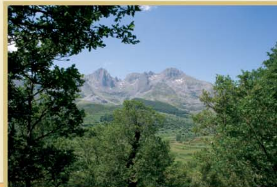
Algunos huecos en el arbolado permiten avistar la quebrada línea del horizonte que dibujan los Picos de Mampodre.