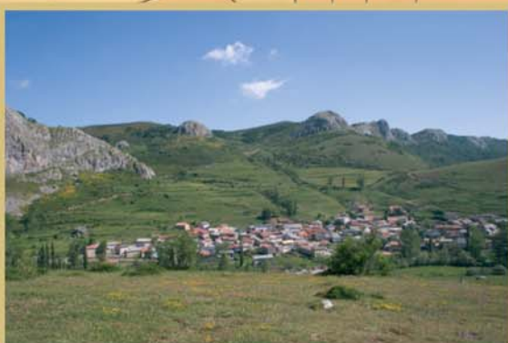
Maraña es un pueblo de montaña tradicionalmente ganadero, en el que se vivía de criar vacas, cabras, ovejas y yeguas.