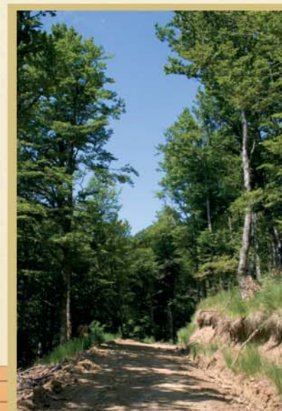
En algunos reductos más frescos del monte se desarrollan llamativos rodales de haya, que dan lugar a zonas de bosque más umbrías y de suelo desnudo, cubierto de hojarasca.