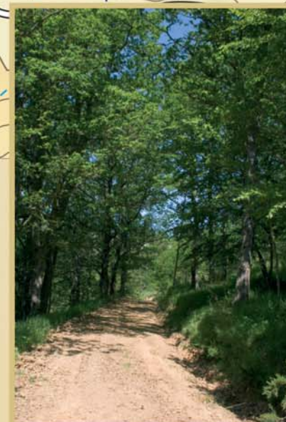
La mayor parte del monte La Boyería es un robleal de roble albar del que se han extraído los ejemplares más grandes para madera.