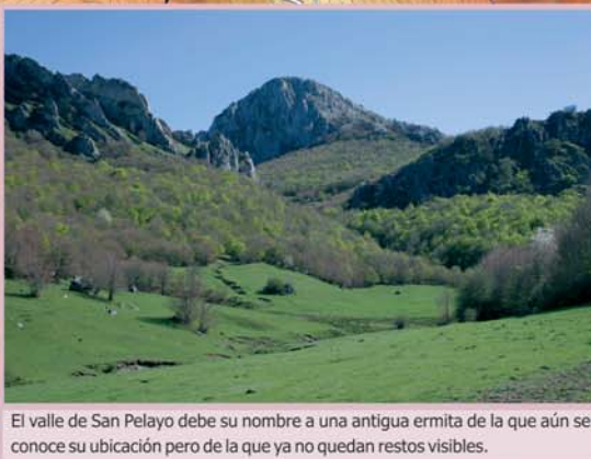
El valle de San Pelayo debe su nombre a una antigua ermita de la que aún se conoce su ubicación pero de la que ya no quedan restos visibles.

En el tramo del valle de Llorada la senda de Liegos a Acebedo se superpone al PR-LE 51 Puerto de Llorada, y se encuentra con el GR 1, cuyo trazado coincide con nuestra ruta hasta Acebedo, razón por la cual este tramo aparece balizado con marcas blancas y rojas de GR.