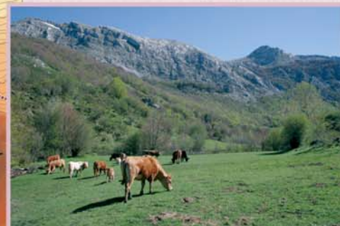
Los pastizales del valle de San Pelayo proporcionan ricos pastos para el ganado vacuno durante la primavera y el otoño.