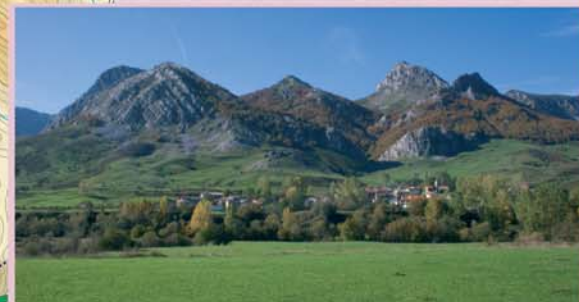
Liegos está emplazado sobre una terraza fluvial del Esla, a los pies del espectacular conjunto de picachos rocosos que forman el Pico de las Canales, la Peña de Tejedo y la Peña de la Cruz.