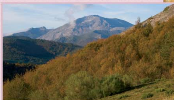
En el descenso del valle de Erendia se disfruta de grandes vistas hacia Peña Ten y Pileñes.