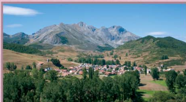
Acebedo ocupa la periferia de una ancha y fértil vega sobre la que emerge poderoso el macizo de Mampodre.