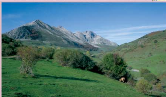
El valle de Corsalines conduce desde Acebedo a la base del Mampodre.