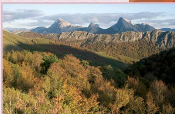
Desde el Collado de Lois, también llamado del Hito, se avista un quebrado escenario de peñas protagonizado por Las Pintas, el Pico Llerenes y el Pico Castaño, todas ellas cumbres que superan los 1800 m de altitud.

En el tramo del valle de Llorada la senda de Liegos a Acebedo se superpone al PR-LE 51 Puerto de Llorada, y se encuentra con el GR 1, cuyo trazado coincide con nuestra ruta hasta Acebedo, razón por la cual este tramo aparece balizado con marcas blancas y rojas de GR.