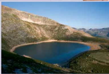
Desde las laderas del Pico Ausente o de la Peña de Requejines se disfruta de las mejores vistas del lago.

Derivación montañera de Requejines: la derivación de Requejines conduce al Lago Ausente por una ruta de montañismo más exigente pero que proporciona grandes vistas del lago y su entorno.