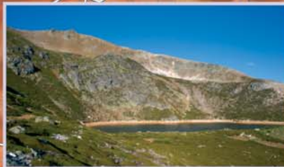
El lago Ausente ocupa una cubeta de origen glaciar excavada en la vertiente septentrional del Macizo del Ausente, con su única vía de escape cerrada, al noreste, por una morrena.