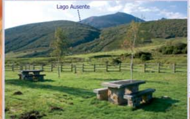
El área recreativa El Praico está situada a orillas del río Isoba, en el lugar de partida de un camino tradicionalmente utilizado para subir al lago Ausente.