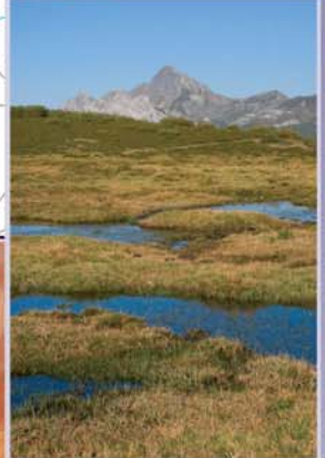
Los numerosos arroyos que recorren la Loma Fonfria dan lugar a pequeñas turberas y zonas encharcadas cuando atraviesan tramos de escaso desnivel. La ruta rodea una de las turberas más importantes de la zona, instalada en un cuenco colmatado, drenado por un sinuoso canal de aguas lentas en el que se pueden detectar tritones, ranas y sapos de varias especies.