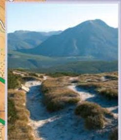
Desde la morrena del lago Ausente se domina una gran panorámica de la sucesión de cumbres que dibujan la divisoria de vertientes de la Cordillera Cantábrica.