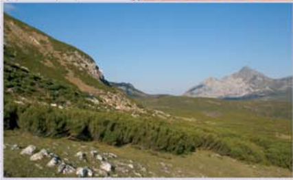
La vegetación dominante en la ruta es un matorral bajo de brezo salpicado de escobas y piornos.