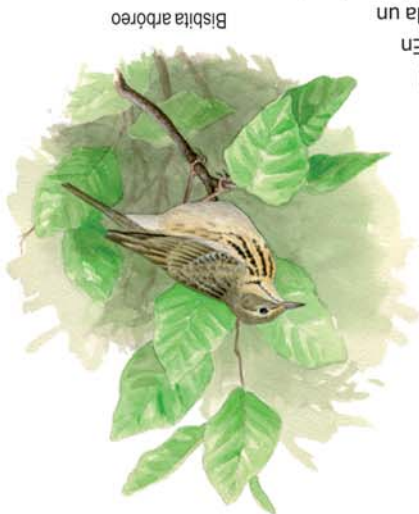
DESCRIPCIÓN DE LA RUTA

Tras este breve desvío seguiremos bajando en busca del valle, cuyo fondo se alcanza al pie de la confluencia de los arroyos de la Tãmbado y Rebueno. A partir de aquí la pista llanea al encuentro de la Fuente Fombea y del área recreativa de Pegarías, donde se recibe por la derecha el camino del circuito corto. En este punto sale a la izquierda un ancho sendero que lleva a la ermita de Pegarías, situada en un resalte del terreno y visible también desde nuestra ruta unos cientos de metros más adelante. Poco después salimos a una pista asfaltada, que da servicio a las minas de talco de Respina, en un valle vecino. Casi inmediatamente, volvemos a desviarnos por un camino que nace a nuestra derecha, al pie de un pequeño refugio, y que bordea la vega del río Silvãn para ir a fundirse con las calles de Puebla de Lillo a los pies de la Casa del Parque del Torreón, donde se puede visitar una exposición complementaria a la Casa del Parque Valle del Porma y donde nos facilitarán información sobre el Parque Regional.