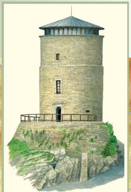
En la vieja torre medieval, se puede visitar la Casa del Parque del Torreón de Puebla de Lillo, donde se muestra una interesante exposición sobre el espacio protegido.