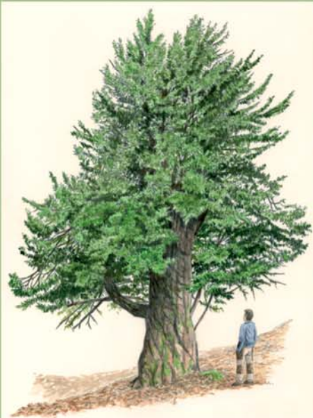
Un corto desvío nos lleva al monte de La Cervatina, donde existe un magnífico bosque de tejos, con algunos ejemplares de tronco extraordinariamente grueso y hasta 10 m de altura.