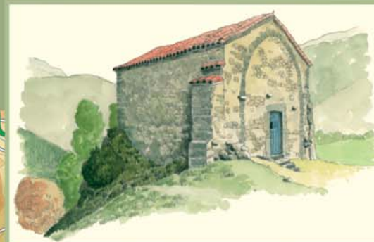
En la ermita de Pegarúas se ofician algunas misas al año, pero ya no se acostumbra a celebrar la romería, con comida campesina incluida, que solía organizar antaño la parroquia de Lillo.