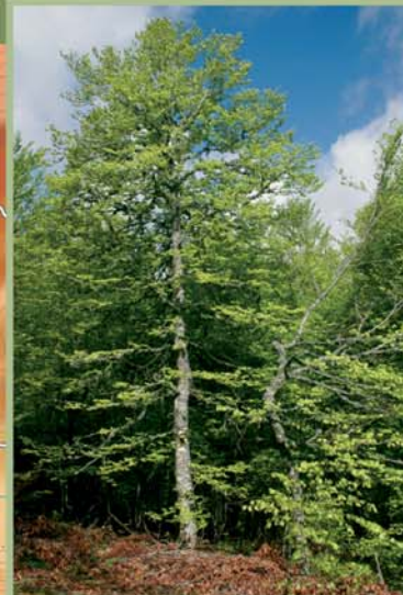
El haya es el árbol dominante en los bosques que atraviesa la ruta.