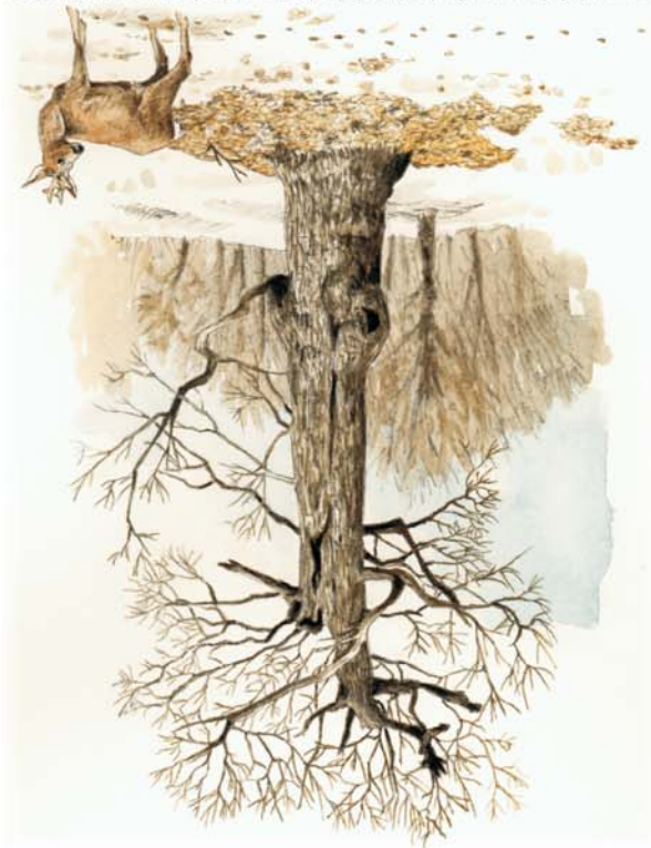
DESCRIPCIÓN DE LA RUTA

A pesar de la hegemonía absoluta de las hayas, en los bosques que atraviesa la ruta crecen pequeñas rodales de acebo y pies solitarios de roble albar, que destacan por su corteza agrietada y sus troncos gruesos y retorcidos. Estos bosques brindan refugio al corzo.