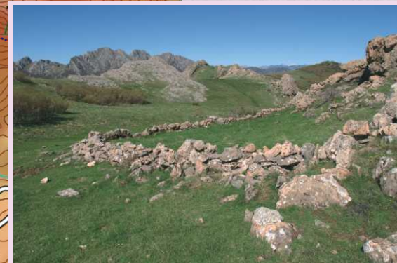
En la subida al puerto de Horcadas se pueden ver los restos de dos chozos y sus respectivos rediles de piedra; eran infraestructuras colectivas que utilizaban los pastores del pueblo cuando subían en vecera durante el verano para atender y vigilar el ganado.