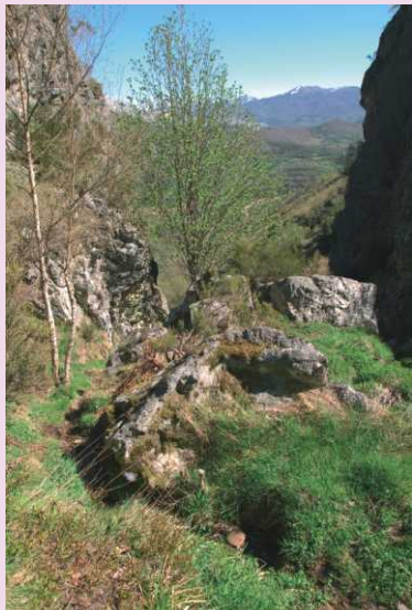
La bajada por la escabrosa Hoz de Los Escalones discurre por un sendero estrecho y empinado, hundido entre altos piornos, sauces, abedules y serbales.