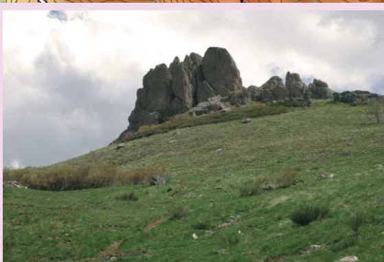
Coronando el puerto llaman la atención varios picachos de roca rojiza que surgen como llamas del pastizal; algo así debieron pensar quienes los bautizaron con el sugerente topónimo de Picos del Diablo.