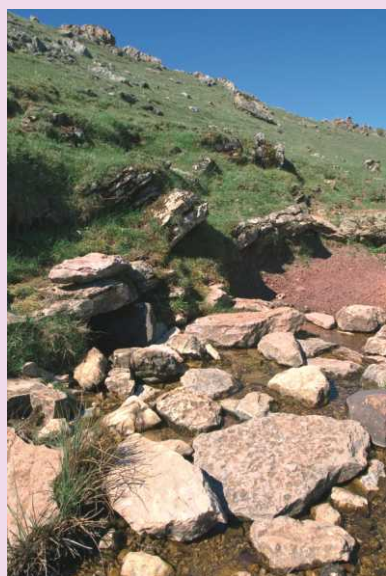
En la fuente La Prada se reunían antaño en animadas meriendas los pastores de Horcadas, Remolina y Huelde, que tenían sus rebaños en zonas colindantes, así como el pastor trashumante de merinas que solía subir a terrenos de Remolina durante el verano.