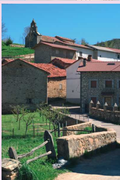
Horcadas fue un pueblo ganadero en el que se sabía aprovechar de forma bien organizada los recursos del campo. Así, el puerto de Horcadas se utilizaba como pasto para el ganado vacuno de hasta 2 años de edad entre junio y mediados de agosto, cuando era reemplazado por ovejas hasta mitad de septiembre.