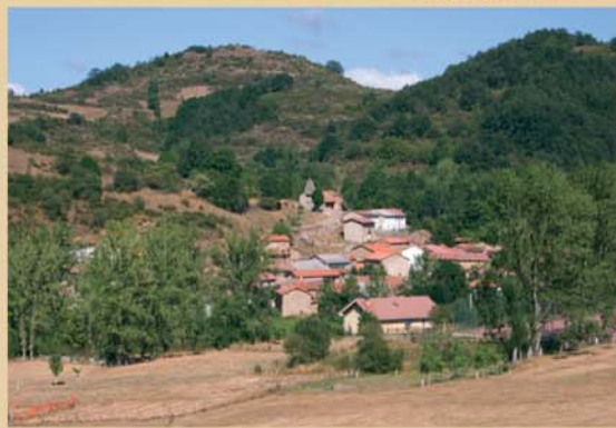
Dominando el caserío de Horcadas, la iglesia de San Cornelio y San Cipriano, de los siglos XIV a XVI, está declarada Bien de Interés Cultural.