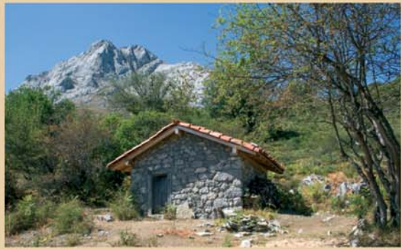
El chozo de Risosa es un refugio de pastores restaurado que puede brindar asistencia al senderista.