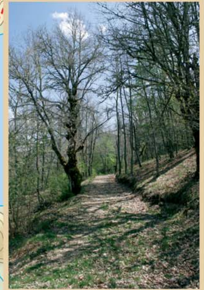
Entre Risosa y Carande la ruta atraviesa un precioso robledal en el que se entremezclan robles albares y rebollos.