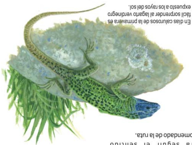
En días calurosos de la primavera es fácil sorprender al lagarto verdinegro expuesto a los rayos del sol.

Como alternativa al circuito Carande-Horcadas-Risosa-Carande también es posible hacer la ruta desde Las Viescas, opción que incrementa la longitud y requiere más esfuerzo. Partiendo del área recreativa, hay que tomar la pista forestal que sube en dirección al hayedo, alejándose de la orilla del pantano. Una vez dentro del bosque, se sigue un desvío a la izquierda que sube en zig-zag por Canal Moro hasta un collado que da paso a la vaguada de Vallarqué. A través de otro alto cercano, llegaremos al cruce del Prado de la Collada, donde se aconseja iniciar el circuito bajando hacia Carande para seguir el sentido