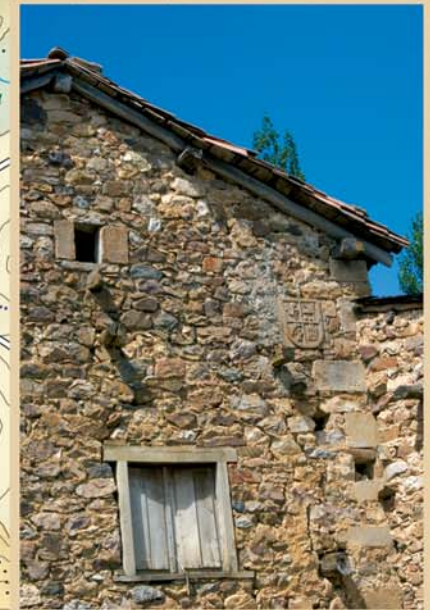
Asentado en una suave pendiente que termina en el pantano de Riaño, Carande esconde detalles valiosos de arquitectura rural.