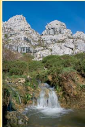
En época de lluvias se forman abundantes torrentes que se desuelgan desbocados por las laderas que limitan el valle de Valderriero formando, en algunos casos, vistosas cascadas y saltos de agua.