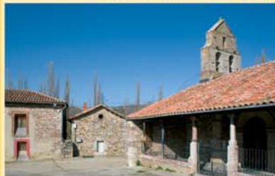
Reyero es la capital administrativa de un pequeño municipio rural que integra otros tres pueblos: Pallide, Viego y Primajas.