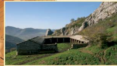
El redil de Recubiles sirve de refugio para el ganado de Reyero, cuando se traslada a los pastos de altura.