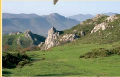
El puerto de Valdehigiende era frecuentado hasta hace pocos años por rebaños trashumantes de ovejas merinas.