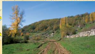
La parte baja de Valderriero conserva choperas ribereñas y laderas forestadas, cubiertas por tupidos robledales.