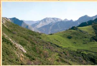
La collada de Lois da vista a la recogida cabecera del río Dueñas, donde se asienta el pueblo de Lois con su iglesia monumental.