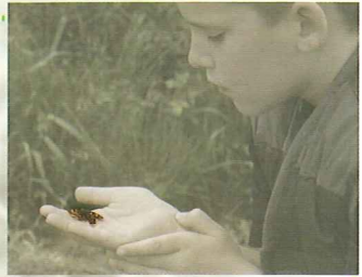
a Berberana Monumento Natural de MONTE SANTIAGO

La red de senderos de este Parque Natural permite conocer sus rincones más sugerentes, los pueblos que lo integran; en definitiva, la esencia de este territorio.