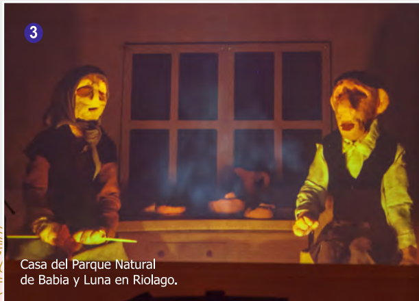
Casa del Parque Natural de Babia y Luna en Riolago.