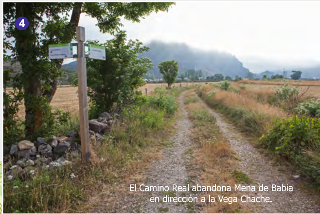
El Camino Real abandona Mena de Babia en dirección a la Vega Chache.