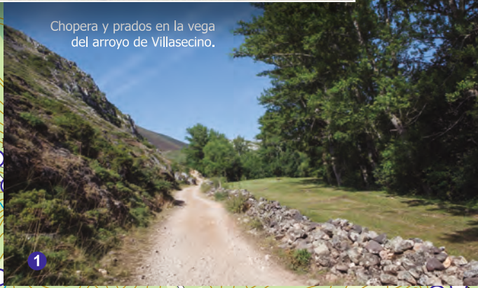
Chopera y prados en la vega del arroyo de Villasecino.