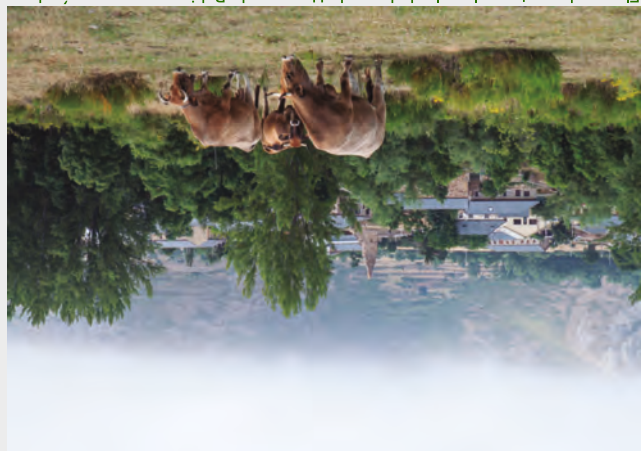
La ermita de Nuestra Señora de Lazado se alza en un hermoso paraje a orillas del camino de Las Fornas, que comunica Villasecino con Riolago.