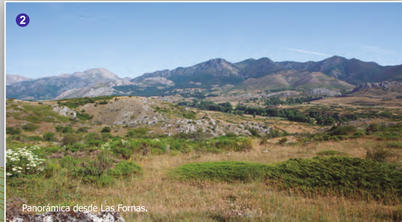
Panorámica desde Las Fornas.