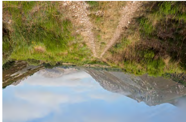
El collado de Mena da acceso al valle del arroyo del Monte.

A partir de Mena, la ruta sigue un trazado rectilíneo y directo por los caminos que delimitan los prados de siega de la amplia llanada de la Vega Chache. Este trayecto finaliza en Quintanilla de Babia , desde donde prosigue en paralelo a la carretera local hasta el final de ruta en Piedrafita de Babia .