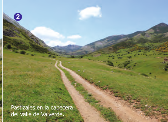
Pastizales en la cabecera del valle de Valverde.