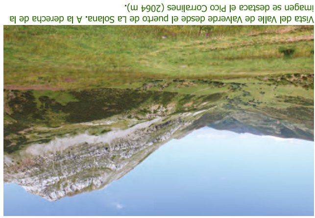
Vista del Valle de Valverde desde el puerto de La Solana. A la derecha de la imagen se destaca el Pico Corralines (2064 m).

El último tramo es una cuesta mucho más pronunciada que termina al pie de los chozos, en un enclave que ofrece una grandiosa panorámica antes de enfilarse hacia los chozos del puerto de La Solana, que se ven desde altitudes que superan los 2000 m.