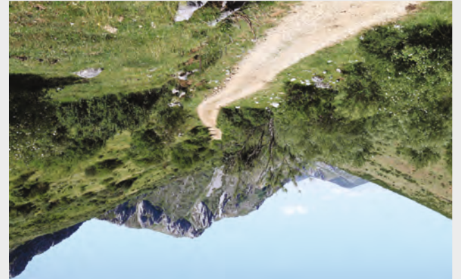
El valle se va abriendo progresivamente a medida que ganamos altitud a través del paraje de Las Trabazas.