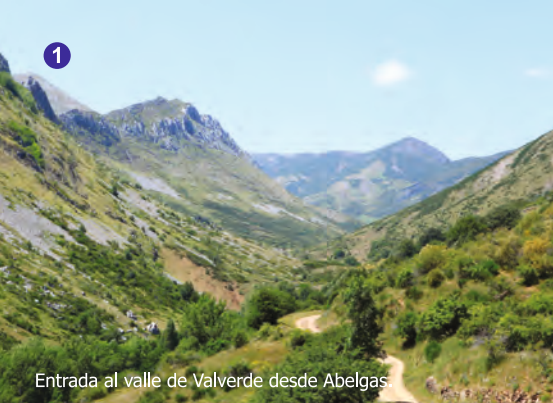
Entrada al valle de Valverde desde Abelgas