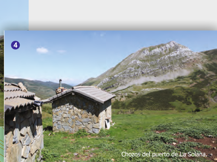
Chozos del puerto de La Solana.