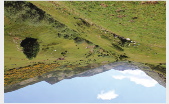
Valle de Valverde. La cima más elevada a la derecha de la imagen es el Pico Penouta (2108 m), en cuyas faldas se asienta el puerto de La Solana.

Casa del Parque Natural de Babia y Luna, Palacio de Quiñones. C/ Real s/n - 24143 Riolago (León). Tfno. 987 687 554 - cp:bbialuna@pattrmonionatural.org