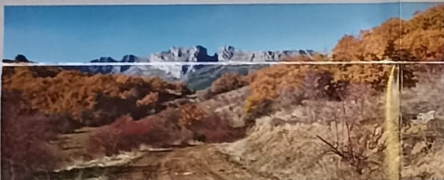
A partir de Ultrero, el camino discurre entre pastizales y densas matas de rebollo, siempre con la característica hendidura de La Forqueta en el horizonte.