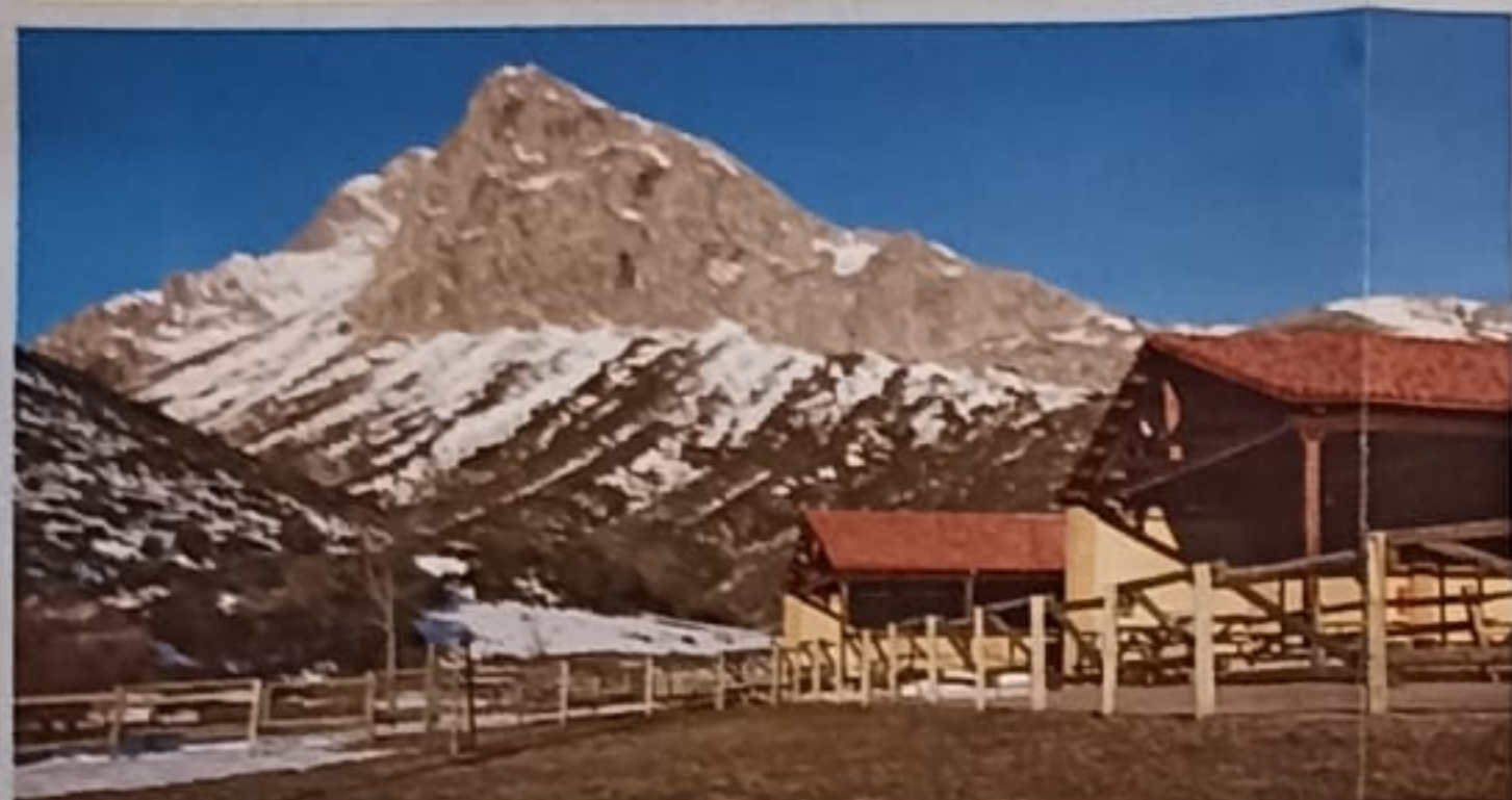
Situado a los pies de la formidable pirámide caliza del Susarón, Camposolillo fue abandonado a consecuencia de la construcción del embalse del Porma, cuyas compuertas se cerraron en 1968.