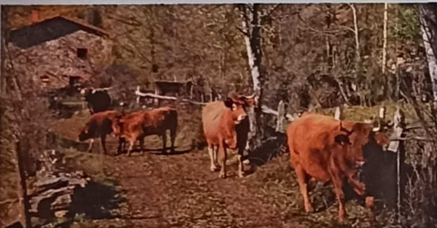
En las cercanías de Rucayo es frecuente cruzarse con pequeños rebaños de ganado, a pesar de que cada vez son menos los habitantes que viven en el pueblo todo el año.