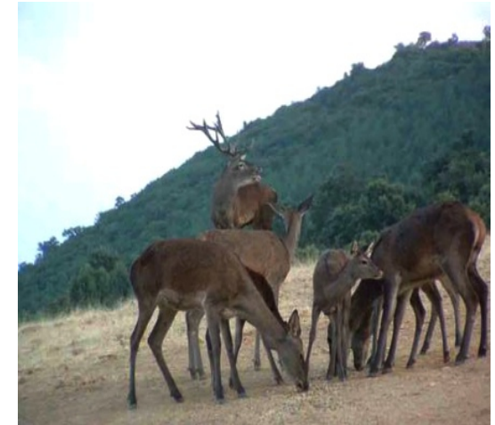
Macho con su harén.

Con las primeras lluvias de septiembre se comienzan a escuchar los berridos de los machos, es un sonido profundo y largo, parecido a un mugido de vaca. Durante un mes los machos no dejarán de emitir fuertes berridos o bramidos. Con este gesto anunciará la llegada del celo y avisará de su presencia a las hembras y al resto de los machos.