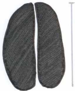
Huella de ciervo.

El tamaño de la cuerna depende de múltiples factores, la edad, la alimentación, la salud, etc..., desarrollándose cada año en mayor menor medida.