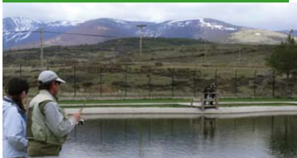
Pineda de la Sierra

Estas instalaciones están abiertas a toda la población, niños, jóvenes y adultos y a los colectivos de pescadores que se inician en esta afición, en particular.