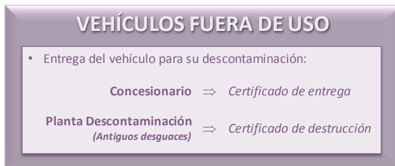
Figura 7. Entrega de vehículos fuera de uso. (CTME, 2011)

Los vehículos al final de su vida útil deben descontaminarse antes de ser sometidos a cualquier otro tratamiento. Por ello, el titular de un vehículo tiene la obligación de entregarlo a un centro autorizado de tratamiento, bien directamente, o a través de una instalación de recepción (concesionarios), momento en el cual el vehículo adquiere la condición de residuo, y como tal debe gestionarse.