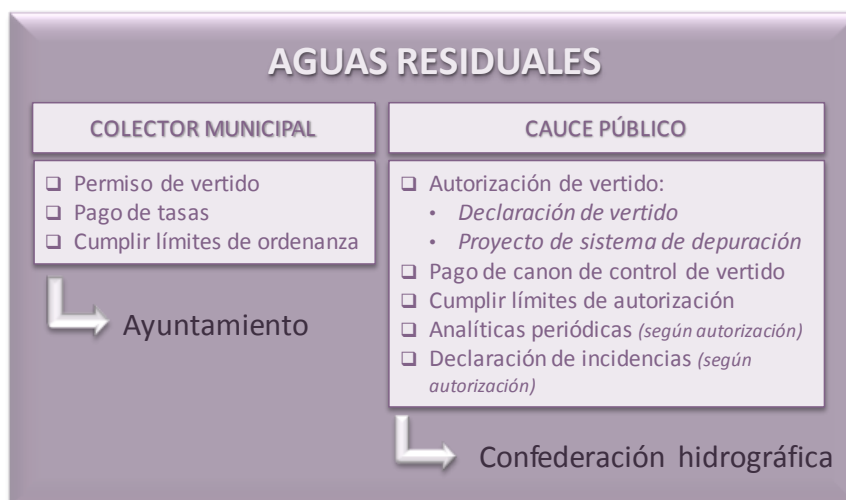
Figura 4. Requisitos legales en el vertido de aguas residuales. (CTME, 2011)

Al igual que ocurre con la captación de aguas, la competencia está derivada a los ayuntamientos en los colectores municipales y a la Confederación Hidrográfica en los vertidos a cauce público.