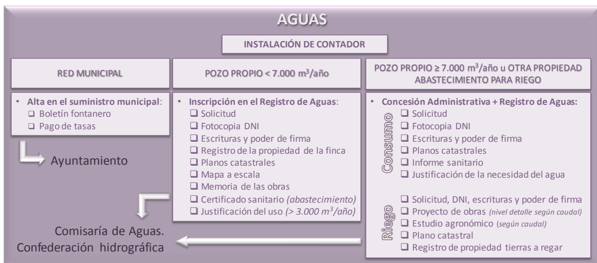
Figura 3. Trámites administrativos para la legalización de la captación de agua. (CTME, 2011)

El abastecimiento de agua está regulado según la fuente de suministro. El Ayuntamiento regula la toma de agua de la red municipal y la Comisaría de Aguas de la Confederación Hidrográfica el aprovechamiento de las aguas del Dominio Hidráulico Público, tanto superficiales como subterráneas. El objetivo de esta regulación es evitar la sobreexplotación de los recursos hídricos.