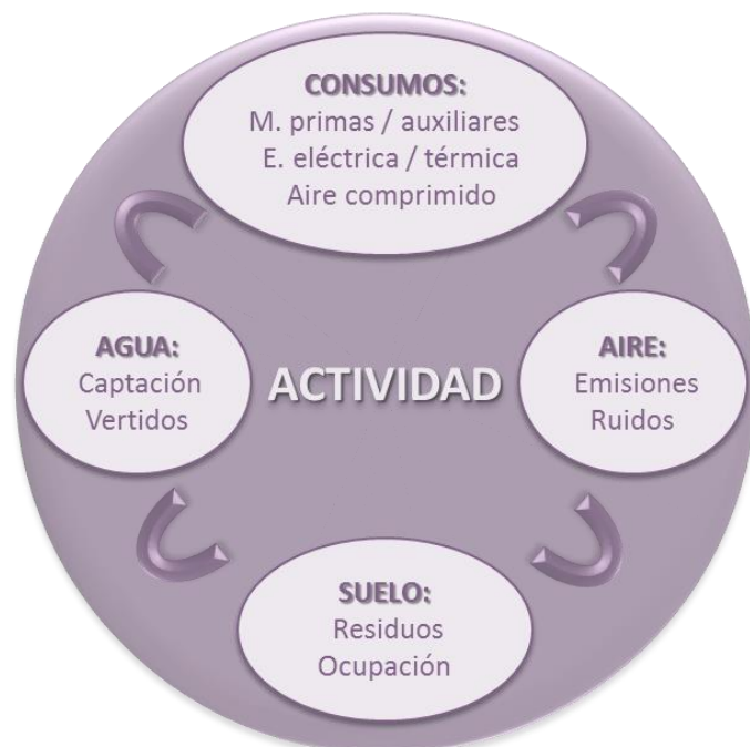
Figura 1. Aspectos ambientales. (CTME, 2011)

Por tanto, un aspecto ambiental es aquel que una actividad, producto o servicio genera (en cuanto a emisiones, vertidos, residuos, ruido, consumos, etc.) que tiene o puede tener incidencia sobre el medio ambiente, entendido éste como el medio natural receptor de los aspectos ambientales.