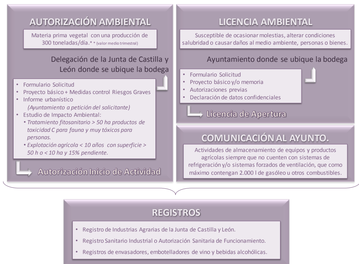
Figura 2. Requisitos para el inicio de la actividad. (CTME, 2011)

Estos requisitos están enmarcados en el concepto de desarrollo sostenible, es decir, que las actividades económicas sean compatibles con la protección del medio ambiente. Por lo que existen diferentes obligaciones en función del impacto potencial sobre el entorno.